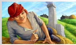
ИВАН-ДУРАК ВОСЬЕ НЕ ДУРАК

Примечательно, что именно в таком употреблении слово «дурак» впервые зафиксировано в русском языке. Тогда оно не было обидным, обозначая, по одной из гипотез, младшего ребёнка в семье. Имя «Дурак» встречается в церковных документах до 14–15 веков. С 17 века оно начинает приобретать современное значение – глупый человек. Естественно, ведь самый младший – самый неопытный и несмышлёный.